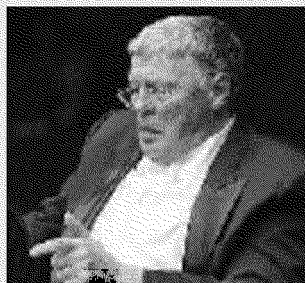
Il direttore Jeffrey Tate

pallide sonorità e nei lunghi indugi faceva pensare a una libera rêverie schumanniana: eppure è tutta scritta da Mozart, simulando l'improvvisazione, ed è stato merito dell'Anderszewski averne fatto il cuore poetico del Concerto. Anche negli Allegri lo stile mozartiano del nostro pianista, con qualche lieve nervosismo, era nitido e sicuro; ma